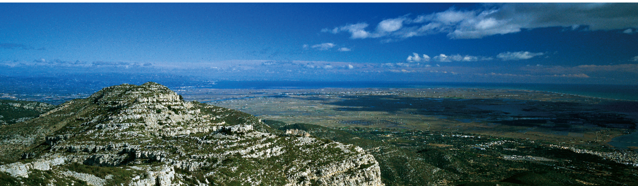
El delta de l'Ebre des de la serra de Montsià

d'una persona, comporta que el territori vagi perdent el seu potencial com a element d'identificació col·lectiva. D'aquí els sentiments de pèrdua, de desarrelament, allò que els anglosaxons han batejat com placelessness . 13 És inqüestionable la capacitat dels humans per sobreviure a noves situacions; tanmateix, res és gratuït. Caldrà veure el preu que haurem de pagar pels ritmes de les transformacions i els canvis actuals. En tot cas, la pèrdua de paisatges i el des-