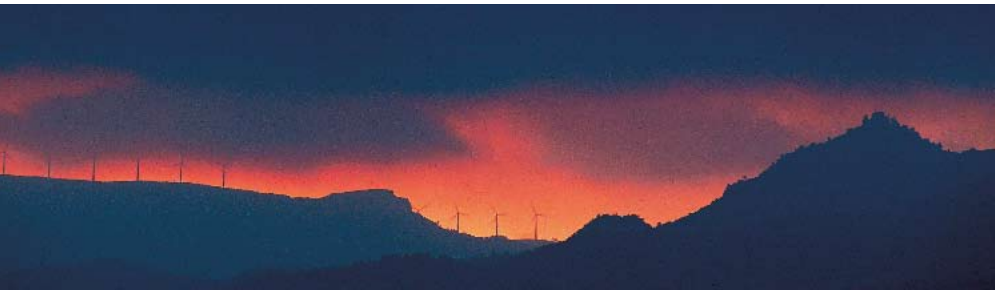
La serra de l'Argentera, Escornalbou i la muntanya de Santa Bàrbara

lades de reduïda escala, estretament vinculades per nombroses conques visuals. El territori difícilment podrà digerir el que li ve a sobre. És a dir, d'acomplir-se les previsions, la sensació dels habitants i dels visitants de les comarques meridionals de Catalunya serà molt propera a sentir-se «envoltats» de molins, amb la majoria d'horitzons «industrialitzats». Aquesta és probablement la major amenaça i, ja que no es pot abordar des de la perspectiva d'un projecte concret, la