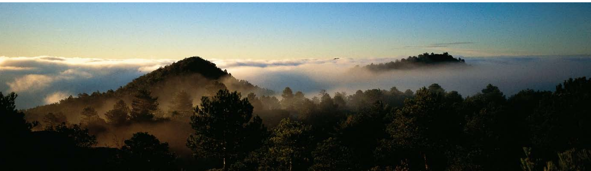
Les puntes de la serra de la Gritella treuen el cap per sobre el mar de núvols que cobreix el Camp

Probablement perquè han esdevingut tan familiars i tan «naturals», ens hem acostumat a creure que la seva bellesa és intrínseca. Pensadors com Alain Roger 17 argumenten, però, que la terra roman en la indiferència estètica, que la naturalesa és indeterminada i que fonamentalment és l'art qui la determina. Precisament perquè el paisatge no és tan allò que hi ha, com allò que es veu,