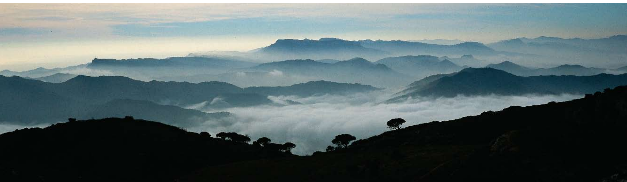
Muntanyes del Priorat i el Baix Camp des de la serra Major del Montsant; al centre i al fons, la mola de Colldejou

Podria semblar que aquestes disquisicions són pròpies de passatemp acadèmics. Ben al contrari, però, les diferents