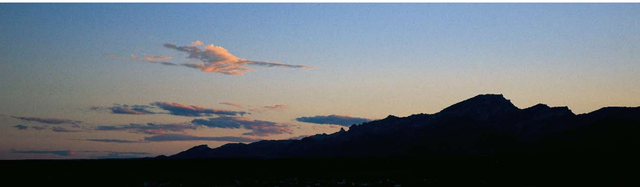
Perfil de les muntanyes del Port, amb el Caro en primer terme, des de Tivenys

Diversos autors (2006): «Desequilibris territorials i eficiència energètica». Plataformes de la Terra Alta, del Priorat, Senan, Montblanquet, la Vall del Corb, Vandellòs – Hospitalet i el Baix Ebre. Document inèdit.