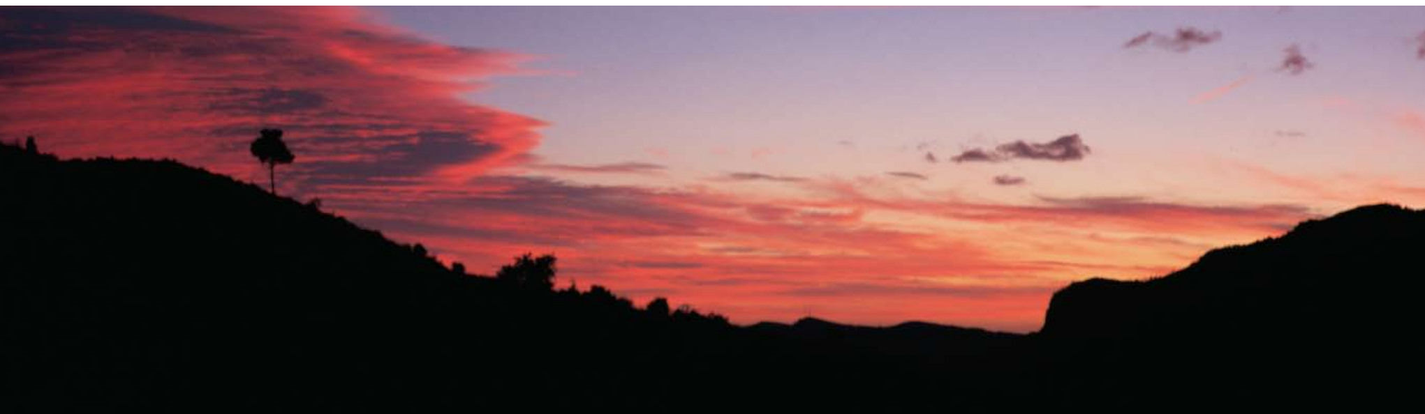
Turons a Scala Dei i el Montsant (Priorat)

Malgrat la seva joventut, la paraula paisatge ha triomfat de tal manera en els nostres dies que ha esdevingut un comodí en àmbits tan diferents com la política, la geografia, la biologia, la pintura o l'urbanisme. Nombrosos pensadors alerten que l'abús i el desgast semàntic